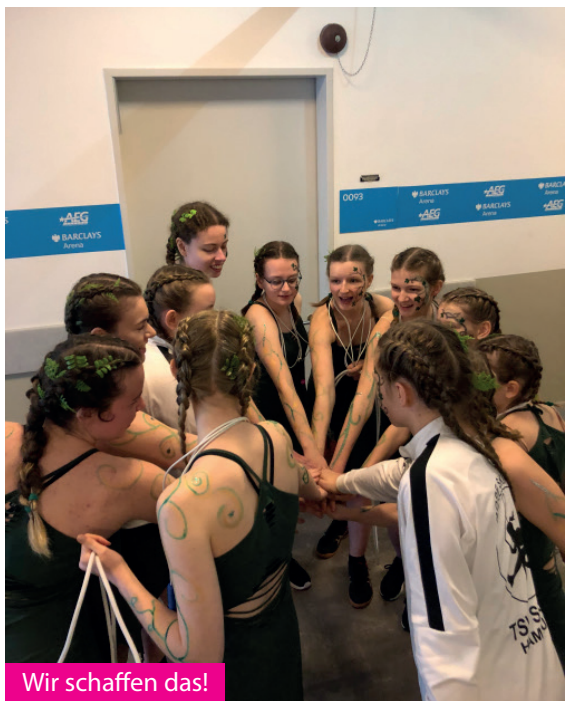
Wir schaffen das!