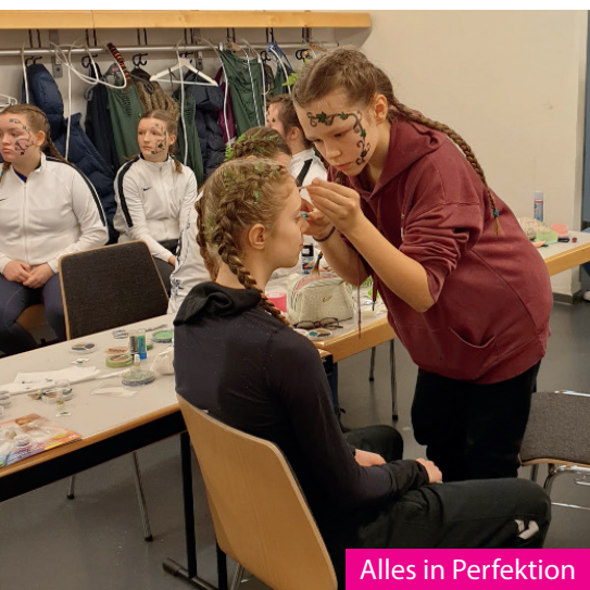
Alles in Perfektion